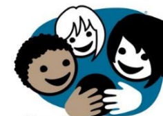
Ver ein god venn