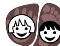
Armar og bein