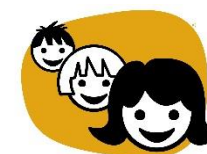
Vente på tur