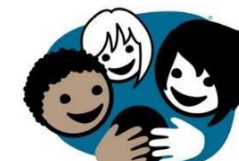
Ver ein god venn