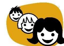
Vente på tur